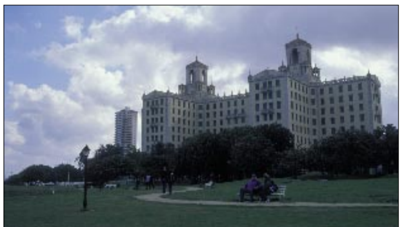
Noc ve slavném Hotelu Nacional stojí „pouhých“ 160 USD. Ve srovnání s turistickými resorty má tento hotel alespoň ducha, patinu zašlé slávy a nádherný výhled na havanskou promenádu zvanou Malecón.

Ten, kdo pronajímá pokoj legálně, má na dveřích označení ve tvaru modrého trojúhelníku a musí každý měsíc státu paušálně odvádět 100-250 USD dle provincie. Pokud víte, kam dorazíte další den, seženou vám domácí bydlení u svých známých či příbuzných. S vyhledáním vhodného ubytování vám ochotně pomohou i tam, kde mají plno nebo vás ubytovat nemohou. Knižního průvodce se seznamem ubytování tak využijete zejména v případech, kdy nejezdíte po Kubě autem a ubytování hledáte až večer na místě.