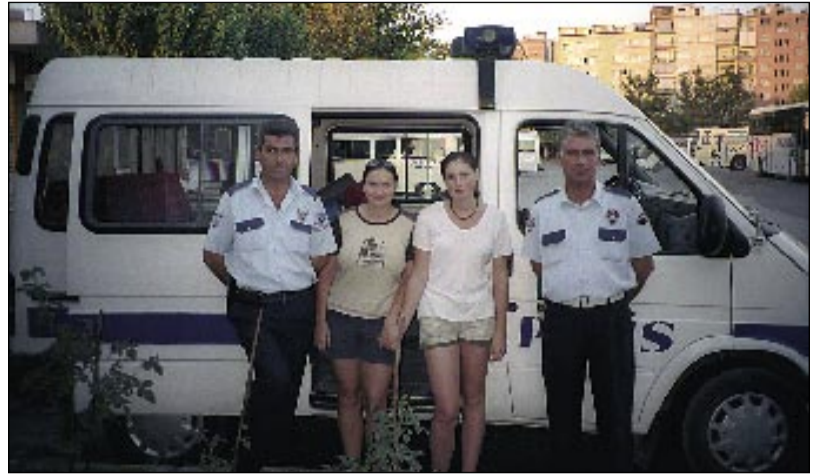
Dodnes jsme nepřišly na to, proč nás tihle policajti vlastně zadrželi. Zřejmě věrní místním zvyklostem, i oni nám nabídli kvalitní sex.

To nejlepší - slavnou Tróju - jsme si nechaly nakonec. Ke vstupu jsme doběhly ve chvíli, kdy zavírali, a my opět řešily, kde budeme spát. Zaujal nás hřbitov, nejklidnější místo ve vesnici. Se spaním na hřbitově jsme měly příjemnou zkušenost už z Řecka. Nenápadně jsme přešly zeď, ale hřbitov sloužil jako smetišť, takže po hodině vyklizení bordelu zpod karimatky jsme se přesunuly na střechu rozestavěného domu. Tam jsme tvrdě usnuly. Alču probudila cizí ruka na jejím rameni. Vedle nás leželi dva chlapi a spojenými ukazováčky gestikulovali, že chtějí sex. Bouřlivou hádku ukončil majitel stavby, který nás vyhodil a ještě vyhrožoval policii. Uložily