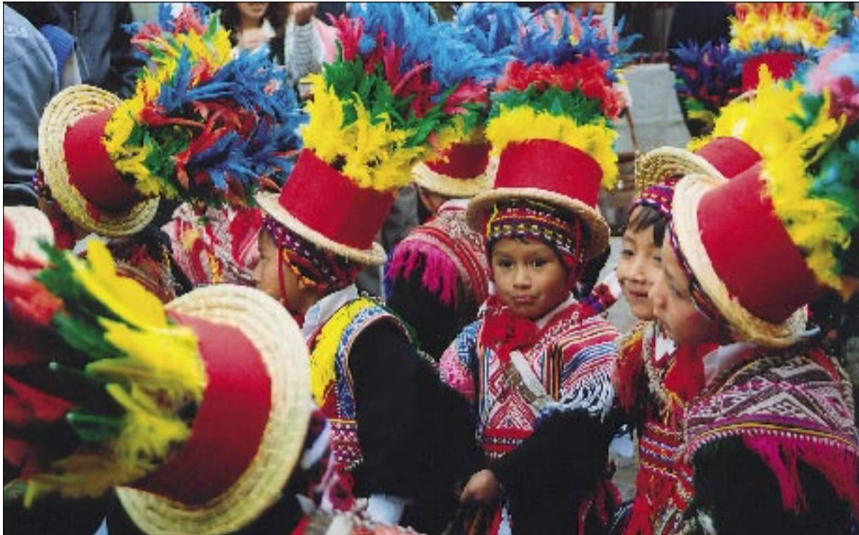
V čele průvodu zahajujícího slavnost tančí děti v barevných krojích, na jeho konci bíle oblečení senioři.

Ceny za ubytování a vnitrostátní letenky šplhají do slunečných výšek, autobusy jsou přeplněné, hostely obsazené a v ucpaných ulicích si mezi nevinými diváky lebedí kapsáři a podvodníci. Již přes 500 let se do posvátného města Cuzka sjíždějí v období zimního slunovratu tisíce Peruánců, aby zde uctili Slunce, hlavního boha incké civilizace. Inkové vždy věřili, že Slunce může jednoho dne vyhasnout a svět se tak propadne do naprosté tmy. Přinášením nezbytných obětí si zaručují jeho přítomnost na nebeské klenbě.