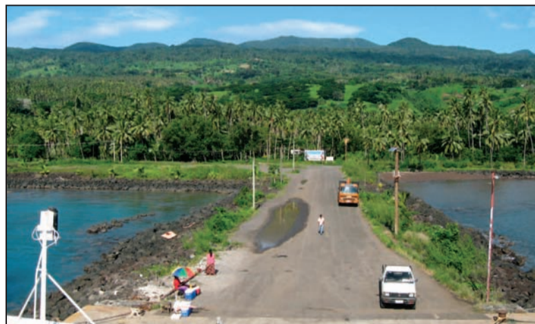
Pohled na pohoří s vrcholem Des Voeux Peak.

Náš vytožený poledník protíná ostrov jen pár desítek metrů od přístavu, kam připlouvá loď ze Suvy, hlavního města Fidži. Vydali jsme se k němu hned po vylodění. Bohužel se zrovna v tu chvíli strhla tropická bouře, což náš zážitek z překročení 180. poledníku mírně „rozmočilo“. Z bouře jsme se vzpamatovali až v indické hospůdce v Somosomo – hlavním městě ostrova. I když to s ohledem na velikost a zástavbu byla na naše poměry spíše vesnice, bylo až překvapivě vybaveno. Člověk zde našel nejen několik hospůdek a obchodů, ubytovnu, autobusové nádraží