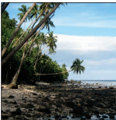
Pláž v národním parku Bouma.

Na ostrově jsme navštívili průvodci vychvalovaný národní park Bouma. Autobusem jsme dojeli do vesnice Lavena, kde silnice končila, a dál už vedla jen po břežní pralesní pěšince. Ta mířila pralesem k vodopádům podél útesové bílé pláže poseté černými a někdy dost zajímavě umístěnými čedičovými kameny. Sám vodopád pak byl zajímavý nejen tím, že se skládal ze dvou částí na dvou stékajících se řekách, ale také přístupovou cestou – muselo se k němu říkou prostě doplatit. Po návratu z národního parku nás místní nenechali přespat ve volné přírodě. Mu-