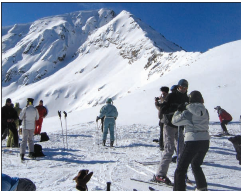
Lyžařské středisko Šiligarnik.

Po příjezdu do Banska nás přivítalo snad nejkrásnější bulharské pohoří Pirin, pojmenované po slovanském bohu Perunovi. Že se blížíte do cíle, poznáte už zdáli. Vichren, nejvyšší hora Pirinu (2 915 m n. m.), se totiž týčí přímo nad Banskem. Samotný příjezd do města byl pro nás tak trochu kulturním šokem. Náš Peugeot 205 tu byl nejhorším autem. Okolo nás se proháněly superlimuzíny a my neustále sváděli boj o místo na silnici s početnými autobusy britských a německých turistů. Na první dojem jsme tedy nebyli z města moc nadšeni.