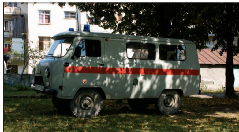
Sanitka, která nás dovezla do nemocnice.

Autobus zpět do Kutaisi měl odjíždět co nevidět, holky však pořád nikde. Najednou se otevřelo v prvním patře nemocnice okno a my v něm vidíme, jak holky sedí na operačním stole, kolem nich snad celá nemocnice, všichni pijí kávičku a hltají zážitky, které jim holky vykládají. Saniták nás poté ještě odvezl k obchůdku, kde si kamarádka podle receptu (naštěstí psaném kromě gruzínského písma i azbukou) koupila dvojce kapky, a poté na autobusové nádražíčko, odkud jsme vyráželi na zpáteční cestu.