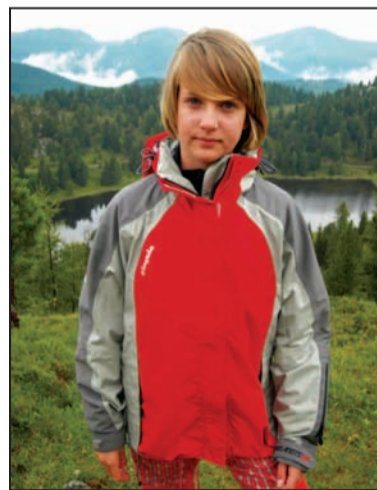
Bunda do každého počasí.

Zatečení vody hlavním zipem brání dvoudílná překlopná léga ijištěná zahnutím